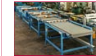
1999: Fördertechnik für Roboterapplikationen – handling equipment for robot applications