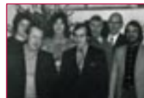
1973: Mitarbeiter 1973 – staff in 1973