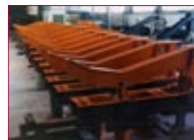
1980: Auswerfer für Rohre – ejector for tubes