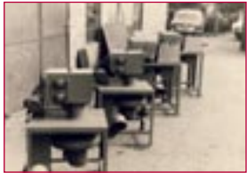
1969: Maschinen für Dichtungssysteme – machines for sealing systems