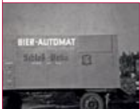
1969: Bierkastenautomat – vending machine for beer cases