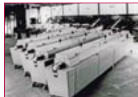
1972: Mikrowellenanlagen – microwave treatment units