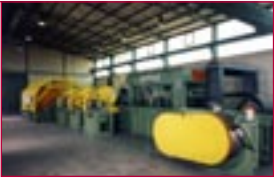
1988: Verseilanlage – wire stranding machine