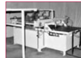
1984: 2. Siebdruckmaschine für Automobilglas – 2nd screen printing machine for automotive glass