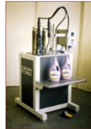
1984: Flaschenabfüllmaschine – bottling machine