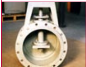
1969: Absperrklappen – shutting flaps