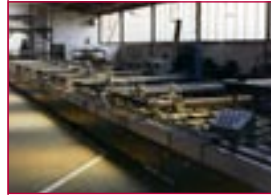
1977: Mehrfarben-Siebdruckmaschine – multicolor screen printing machine

1977: Umwandlung in Maschinenbau GEROLD GmbH & Co. KG – entity is changed to Maschinenbau GEROLD GmbH & Co. KG