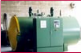
1990: Autoklav – autoclave