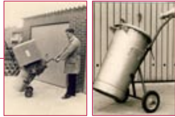
1968: Universelle Transportkarre – universal transport trolley

1968: Gründung von Gerätebau GEROLD durch Wolfgang Gerold – Geraetebau GEROLD is established by Wolfgang Gerold