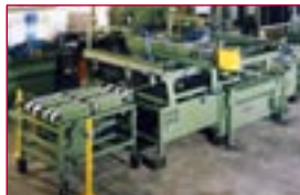
1993: Siebdruckmaschine für Seitenscheiben – screen printing machine for sidelites