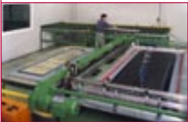
1989: Halbautomatische Siebdruckmaschine für Autoglas – semi-automatic screen printing machine for automotive glass