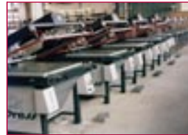
1979: Siebdruckmaschinen – screen printing machines