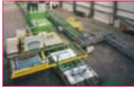
1998: Siebdrucklinie für Windschutzscheiben – screen printing line for windshields

2003: Markteinführung vollautomatischer Vorverbund von Windschutzscheiben – fully-automated lay-up & assembly system for automotive windshields is launched