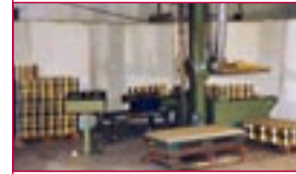
1983: Dosenverpackungsmaschine – tin can palletizing machine

1983: Spezialisierung auf Siebdruckmaschinen für Automobilglas - specialization in automotive glass printing equipment becomes effective