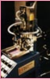
1990: Logo-Siebdruckmaschine – logo-printer