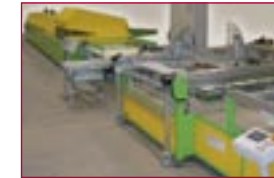
2006: Siebdrucklinie für Seitenscheiben – screen printing line for sidelites