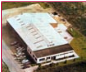
1971: Industriestrasse 6