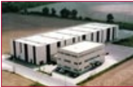
1992: Errichtung des Standorts Herrenpfad-Süd 44 – location Herrenpfad-Sued 44 is set up