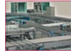
2005: Materialflussverkettung – production flow linking

2004: Produktlinie für Zielmarkt Photovoltaik- Modulfertigung etabliert – product line targeting photovoltaic module manufacturers is launched