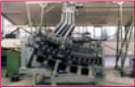
1989: Autoglas-Biegemaschine – bending machine for automotive glass