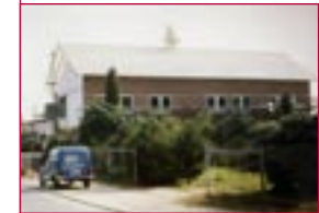
1984: Erweiterung Industriestrasse 6 – extension Industriestrasse 6