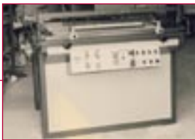
1969: Siebdruckmaschinen – screen printing machines