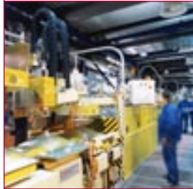
1998: Prozessmaschine für Bildröhren – processing machine for CRT-bulbs

2004: Produktlinie für Zielmarkt Photovoltaik- Modulfertigung etabliert – product line targeting photovoltaic module manufacturers is launched